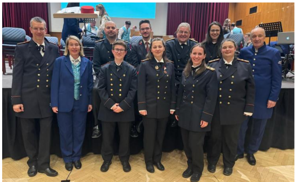
Unsere Musikerinnen und Musiker beim Konzert in Wels